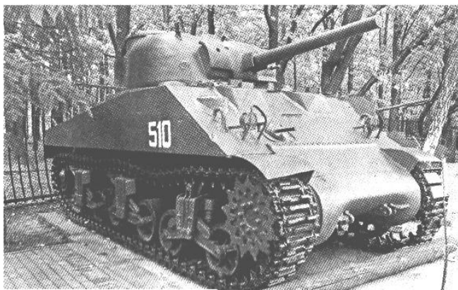
Танк «Шерман» М4А2